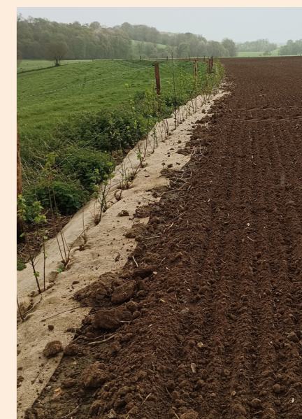
Appel à projet - Plantation de haie - Bouville

De plus, dans le cadre de l'appel à projet "préservons nos sols" le SMBVAS a financé, sur fonds propres, l'implantation de 3 935 arbres soit 1.2 km de haies supplémentaires.