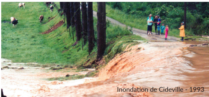
Inondation de Cideville - 1993

Biodiversité, changement climatique, résilience, développement durable, gestion différenciée, etc. autant de thèmes abordés au CERT à travers le parcours pédagogique ou lors d'événements ponctuels.